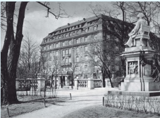
Imagen del Hotel Regina de Múnich, datada en los años 30, que albergó el encuentro entre los días 5 y 6 de Junio de 1962.