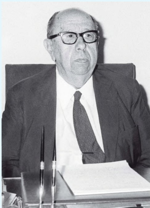
José María Gil Robles.