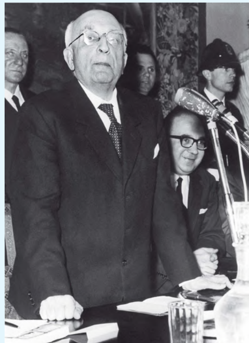
Salvador de Maderiaga.